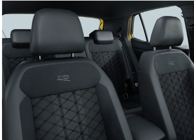
R-Line (Serie): Sport-Komfortsitze in Stoff, Grau