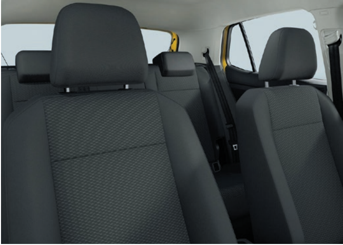
Basis (Serie): Stoff, Titanschwarz