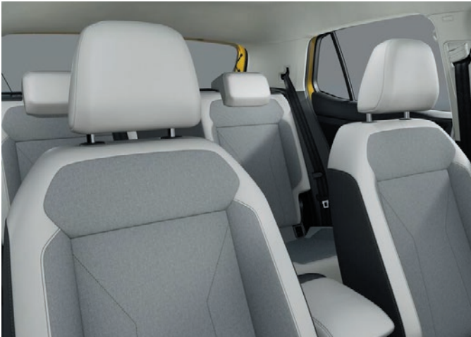
Style (Option Designpaket Style): Sport-Komfortsitze in Stoff, „Mistral“