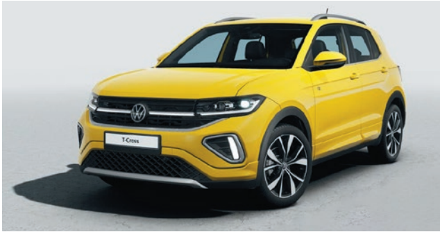
Grape Yellow Uni-Lackierung