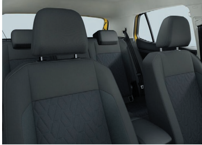
Life/UNITED (Serie): Stoff, Grau-Melange