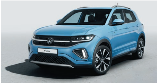
Clear Blue Metallic-Lackierung