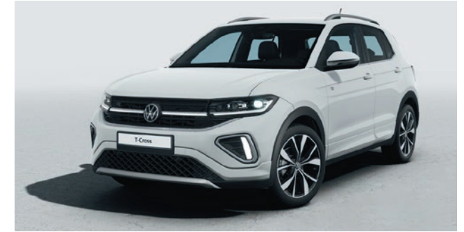
Pure White Uni-Lackierung