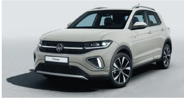
Ascot Grau Uni-Lackierung