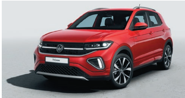
Kings Red Metallic-Lackierung