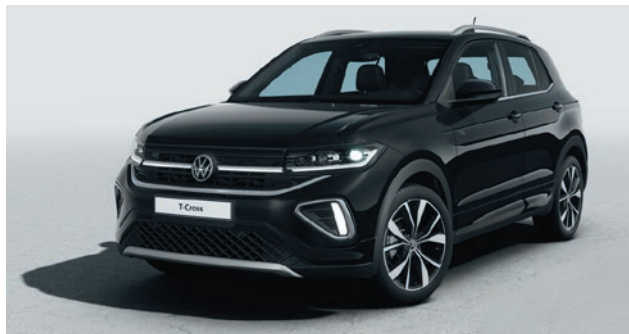
Deep Black Perleffekt-Lackierung