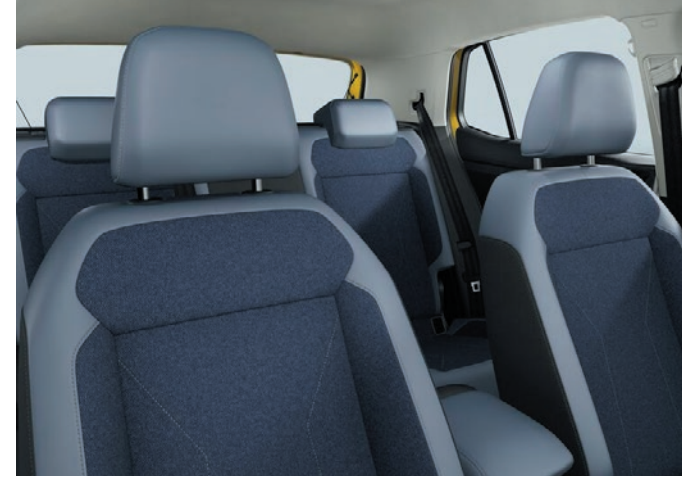
Style (Serie): Sport-Komfortsitze in Stoff, Cosmicblue-Titanschwarz