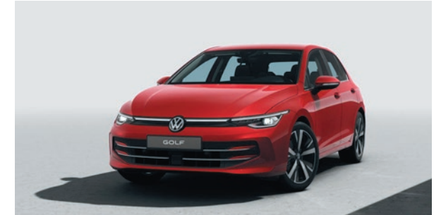
Kings Red Metallic-Lackierung P8P8