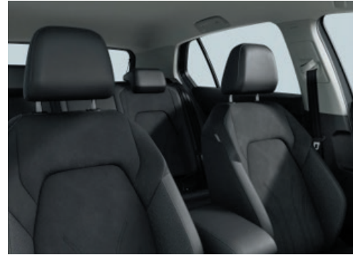
Style / EDITION 50: Stoff / „ArtVelours Eco“ Soul-Schwarz