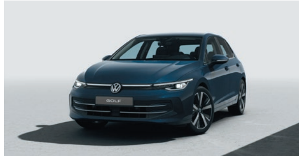
Anemonenblau Metallic-Lackierung 5R5R