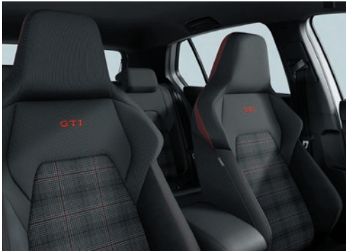
GTI: Stoff „Scale Paper“ Soul-Schwarz