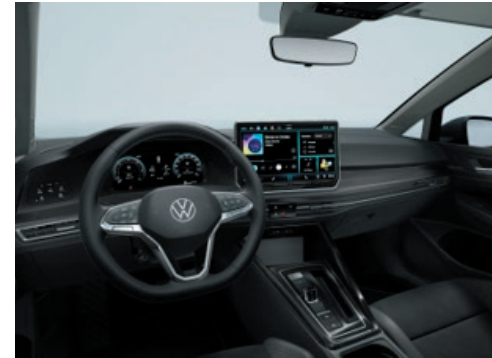
Interieur Style mit Dekoreinlagen „Style“