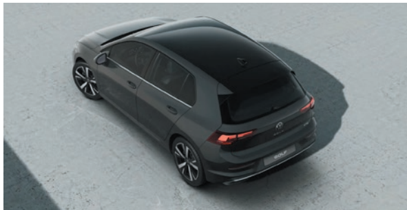
Uranograu Uni-Lackierung 5KA1 zweifarbige mit Dach in Schwarz