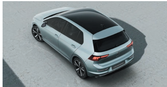
Oyster Silver Metallic-Lackierung F0A1 zweifarbige mit Dach in Schwarz