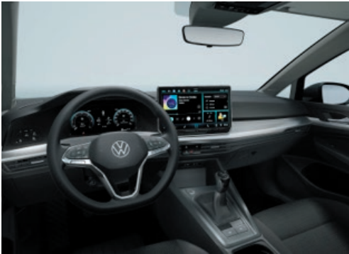
Interieur Basis mit Dekoreinlagen „Nature Cross Brushed“