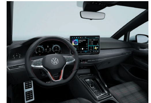
Interieur GTI mit Dekoreinlagen „Mesh Carbon Grey“