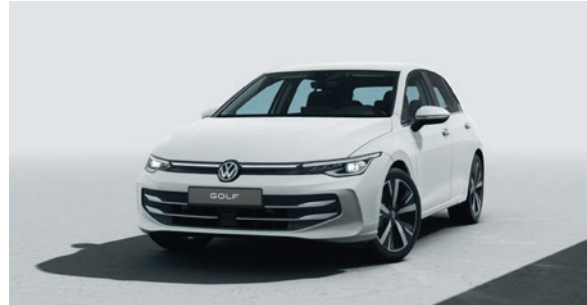
Pure White Uni-Lackierung 0Q0Q