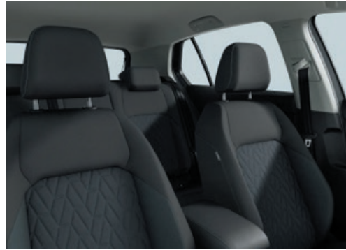
Life / UNITED: Stoff „Life“ Soul-Schwarz