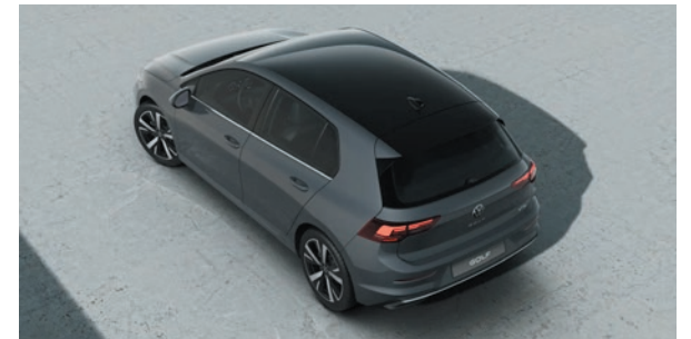
Delfingrau Metallic-Lackierung B0A1 zweifarbig mit Dach in Schwarz