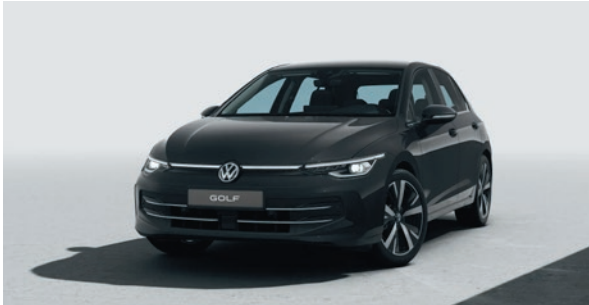
Grenadillschwarz Metallic-Lackierung OE0E