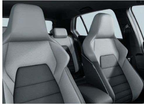
GTE: Leder „Vienna“ Soul-Schwarz