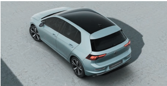
Crystal Ice Blue Metallic-Lackierung 3YA1 zweifarbige mit Dach in Schwarz