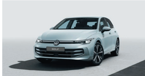
Oyster Silver Metallic-Lackierung F0F0