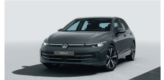
Delfingrau Metallic-Lackierung B0B0