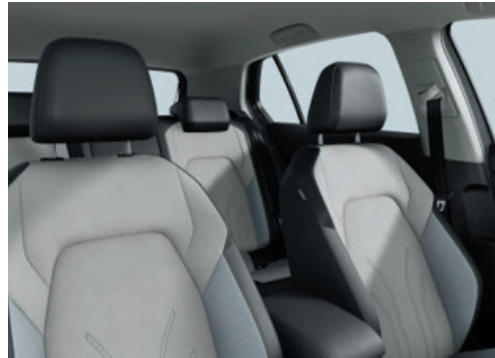
Style: Stoff / „ArtVelours Eco“ Mistralgrau Soul-Schwarz