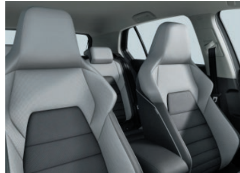
Style: Leder „Vienna“ Mistralgrau Soul-Schwarz