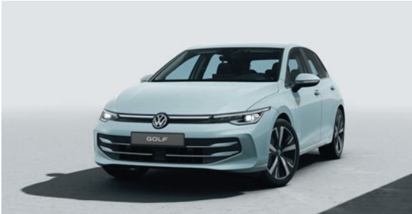
Crystal Ice Blue Metallic-Lackierung 3Y3Y