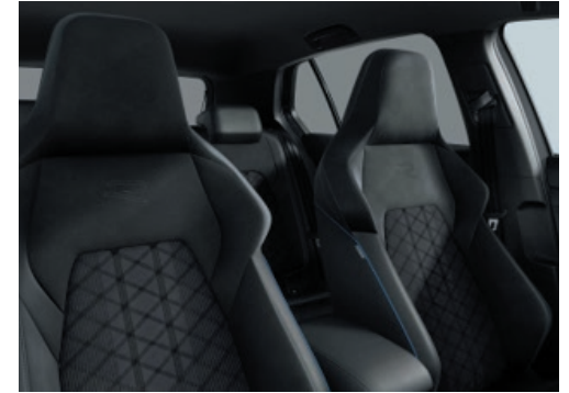
R-Line: Stoff / Innenwangen „ArtVelours“ Anthrazit