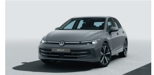
Mondsteingrau Uni-Lackierung C2C2