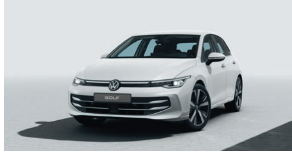
Oryxweiss Perlmutteffekt OR0R