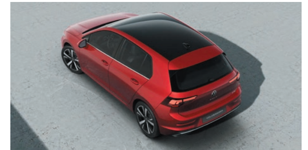
Kings Red Metallic-Lackierung P8A1 zweifarbige mit Dach in Schwarz