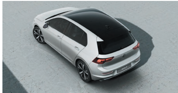
Oryxweiss Perlmutteffekt ORA1 zweifarbig mit Dach in Schwarz