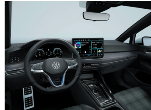
Interieur GTE mit Dekoreinlagen „Mesh Carbon Grey“