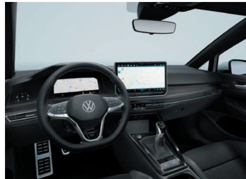
Interieur EDITION 50 mit Dekoreinlagen „Style“