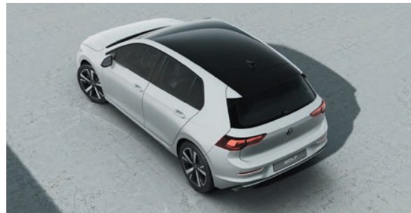
Pure White Uni-Lackierung 0QA1 zweifarbige mit Dach in Schwarz