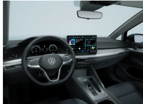
Interieur Life/ UNITED mit Dekoreinlagen „Nature Cross Brushed“