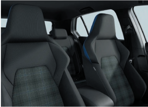
GTE: Stoff „Scale Paper“ Soul-Schwarz