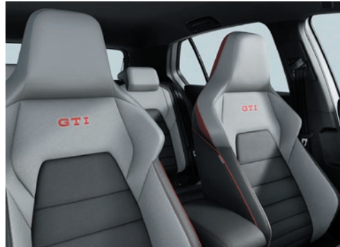
GTI: Leder „Vienna“ Soul-Schwarz