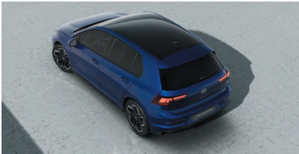
Lapiz Blue Metallic-Lackierung L9A1 zweifarbig mit Dach in Schwarz (nur für R-Line)