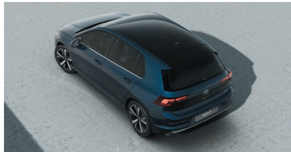
Anemonenblau Metallic-Lackierung 5RA1 zweifarbig mit Dach in Schwarz