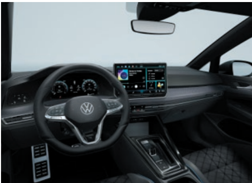
Interieur R-Line mit Dekoreinlagen „Mesh“ in Carbon Grey