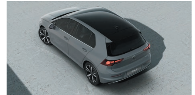
Mondsteingrau Uni-Lackierung C2A1 zweifarbige mit Dach in Schwarz