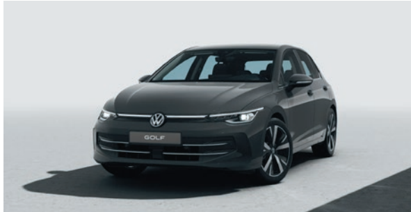
Uranograu Uni-Lackierung 5K5K