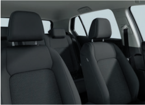
Basis: Stoff „Basis“ Soul-Schwarz