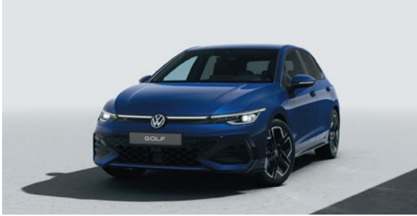
Lapiz Blue Metallic-Lackierung L9L9 (nur für R-Line)