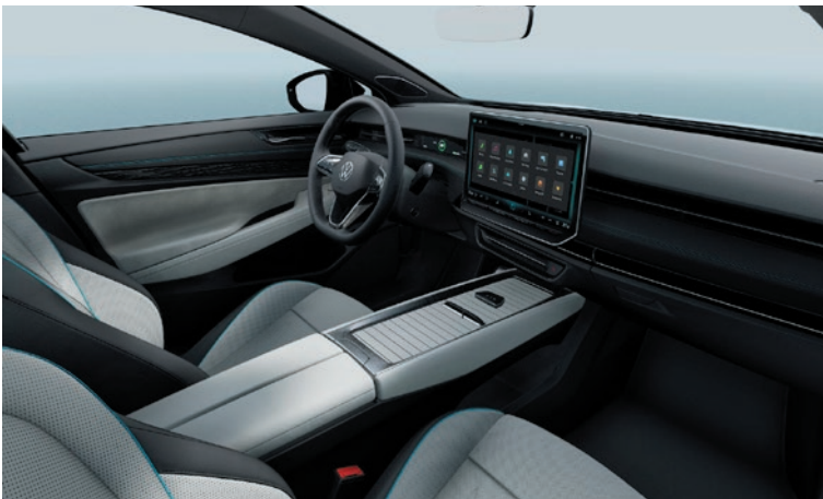
ergoActive Premium Sitze in Mikrovlies „Artvelour Eco Mistral-Soul-Blau“ (Option Pro)