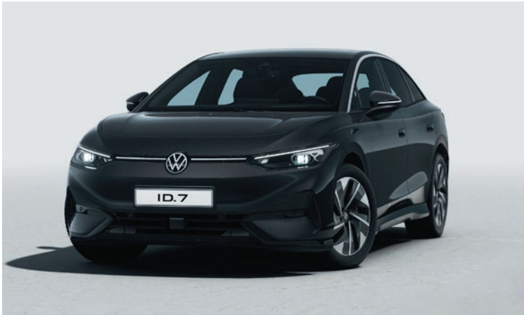
Grenadill Black Metallic-Lackierung