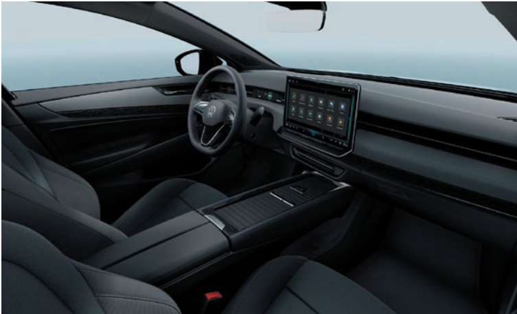
Basis-Sitze in Stoff*, „Grau Melange-Soul“ (Serie Pro)