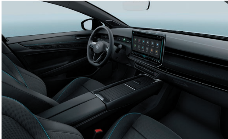
ergoActive Komfortsitze in Mikrovlies „Artvelour Eco in Soul-Schwarz“ (Option Pro)