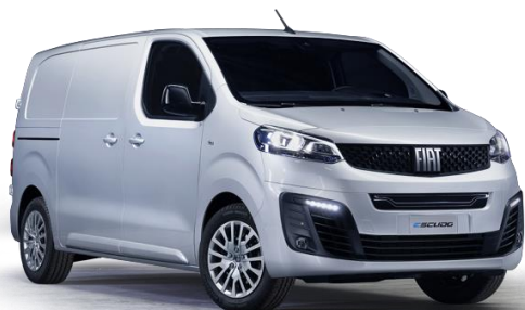
5DM - WEISS