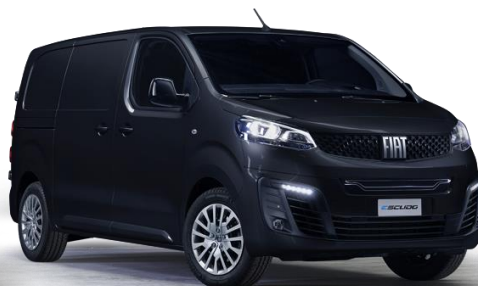
5DP - SCHWARZ PERLA