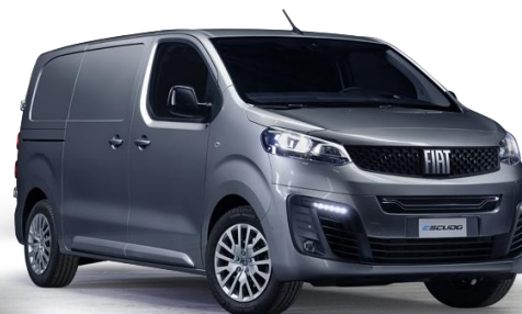
5DN - GRAU ARTENSE