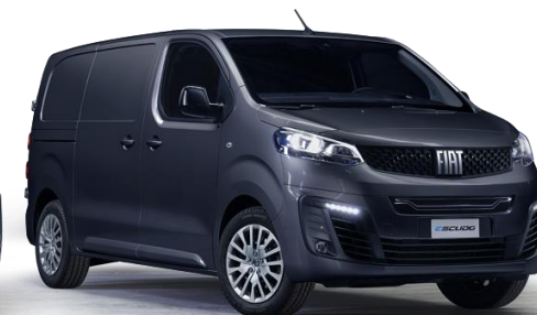
6FW - GRAU PLATIN