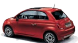
111 Passione Rot