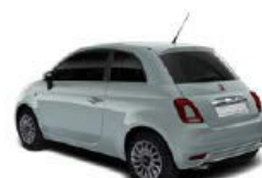
196 Rugiada Grün