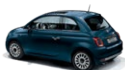
687 Dipinto di blu Blau