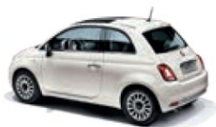
268 Gelato Weiss