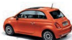
562 Spritz Orange