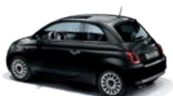
876 Vesuvio Schwarz