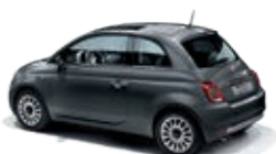
695 Pompei Grau